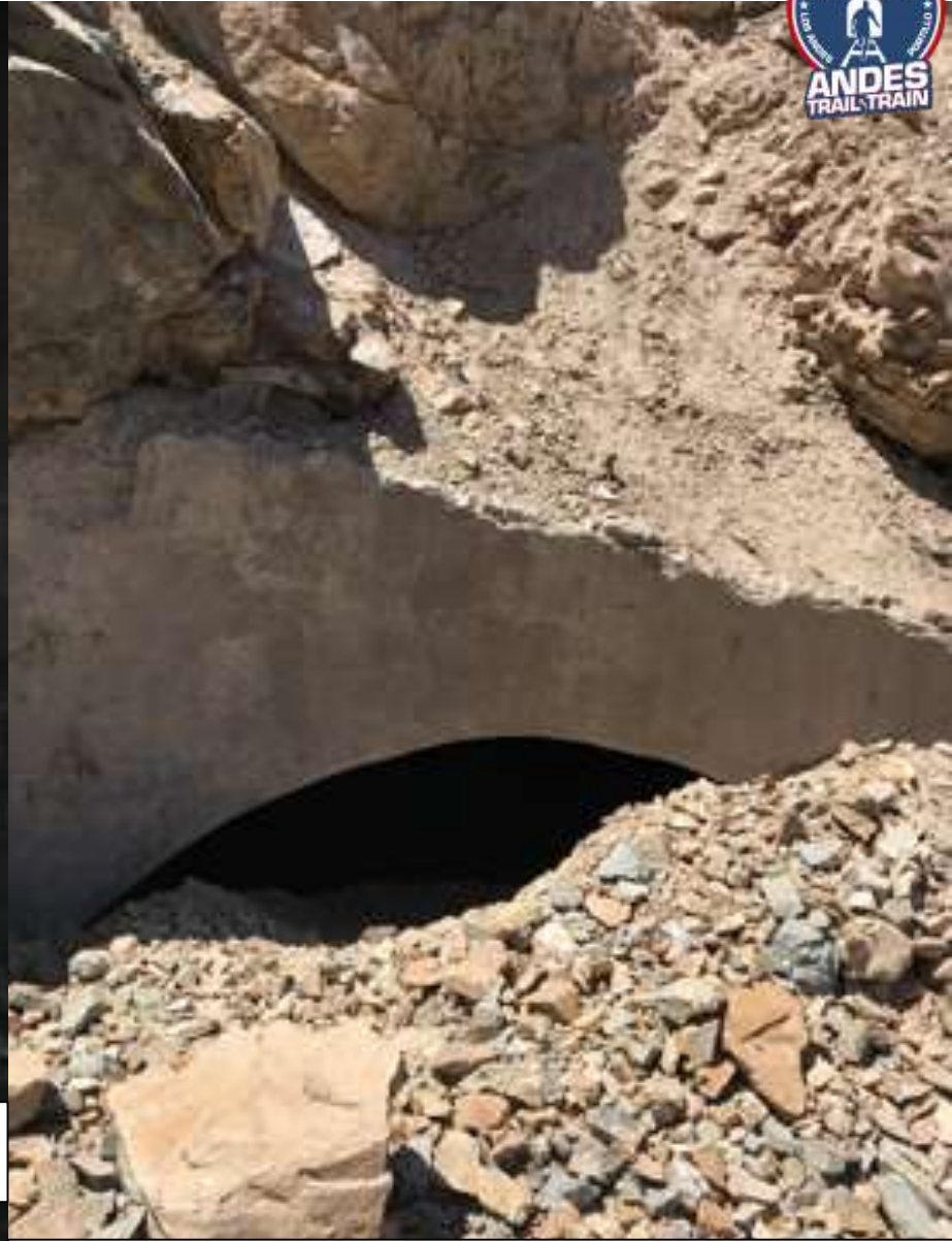
UNO DE LOS TUNELES TIENE UNA SALIDA ESTRECHA DONDE HAY QUE AGACHARSE O GATEAR. NO REVISTE PELIGRO