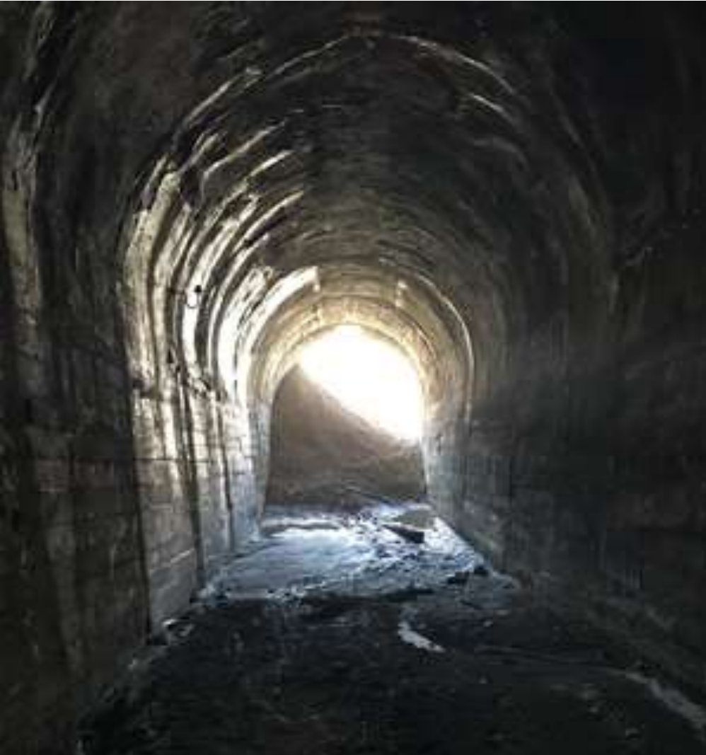
UNO DE LOS TUNELES TIENE UNA INUNDACION MENOR, ES INEVITABLE MOJARSE LAS ZAPATILLAS PERO NO ALCANZA A LOS TOBILLOS